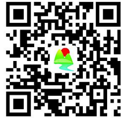
民族和宗教权力事项清单