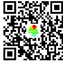
民族和宗教权力事项清单